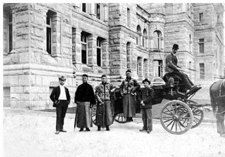
图为加拿大华裔旧照，摄于一九〇四年。

据了解，很多照片是在支持祖国抗战和菲律宾抗日运动中牺牲的在菲华侨的资料，有关人士通过反复和菲律宾同乡会、社团联系，并亲自到菲律宾才找到。