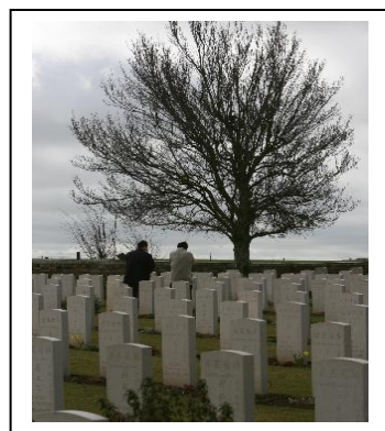
法国诺莱特华工墓园

厘米，高50厘米，用中法文镌刻着：“公元1916年至1918年，有十四万华工曾经在法国参与盟军抗战工作，有近万人因此献出了宝贵的生命。抗战胜利后，其中有三千人定居巴黎，并在巴黎里昂火车站周围形成了第一个华人社区。”