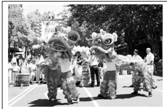
新西兰奥克兰市举行圣诞游行现场中国元素浓厚

据说圣诞节源自新约《圣经》中的圣路加及圣马太，说伯利恒镇有一位天使告诉牧羊人，耶稣已经降临世间。马太福音又说，3位东方贤士在一颗行星的指引下发现了耶稣。可是耶稣的确切生日无人知晓，大多数基督教徒便遵循罗马历书，选定西元336年的12月25日作为“圣诞节”，以此来欢庆耶稣基督的诞生。这本来是个“洋节”然国内已渐渐流行接受这一西方传统文化，而生活在西方的侨胞更应该习惯于眼前的一切。