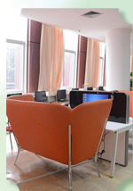
智慧空间3D显示设备