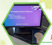
自助缴纳 逾期款服务