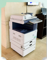
自助复印、打印、 扫描一体机