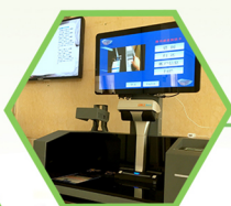
华南首家 自助扫描借还书 一体机