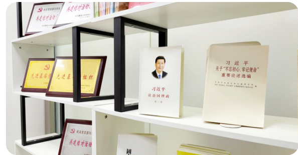
(党员之家摆放实体书)

紧抓不懈，先后以书记上党课、馆领导班子专题研讨、参加机关党委专题学习、支部集中学习、参加共产党员网自测等形式组织学习十余场；还利用图书馆微信公众号做专题推送、自编学习材料，并在“党员之家”摆放实体书供党员学习。