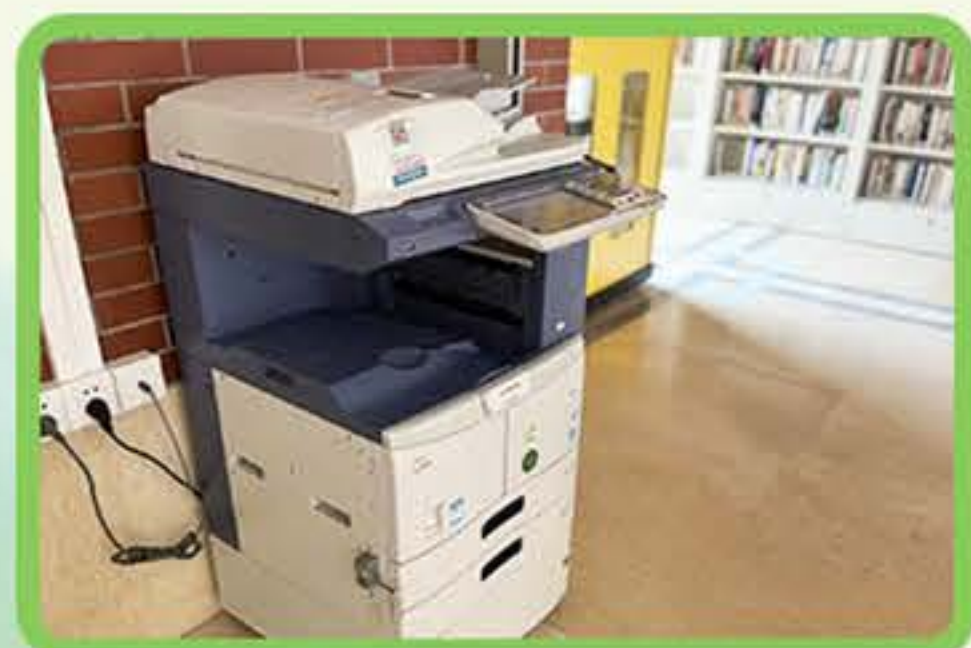
自助复印、打印、 扫描一体机